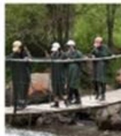
2 Экологиялық туристік маршруттар мен экологиялық турларға қойылатын жалпы және арнайы талаптар