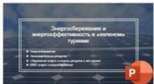
5 Энергосбережение и энергоэффективность