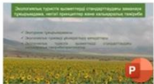
1 Экологиялық туристік қызметтерді стандарттаудағы заманауи тұжырымдама, негізгі принциптер және халықаралық тәжірибе