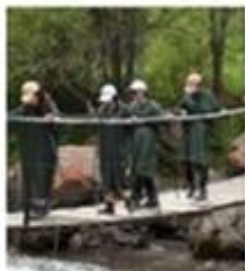
2 Общие и особые требования к экологическим маршрутам и турам