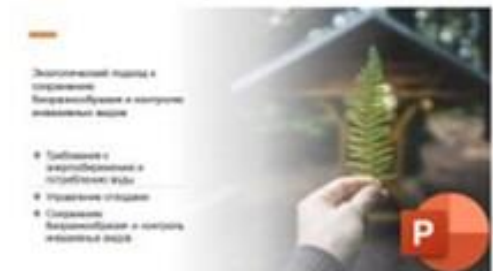
3 Экологический подход к сохранению биоразнообразия